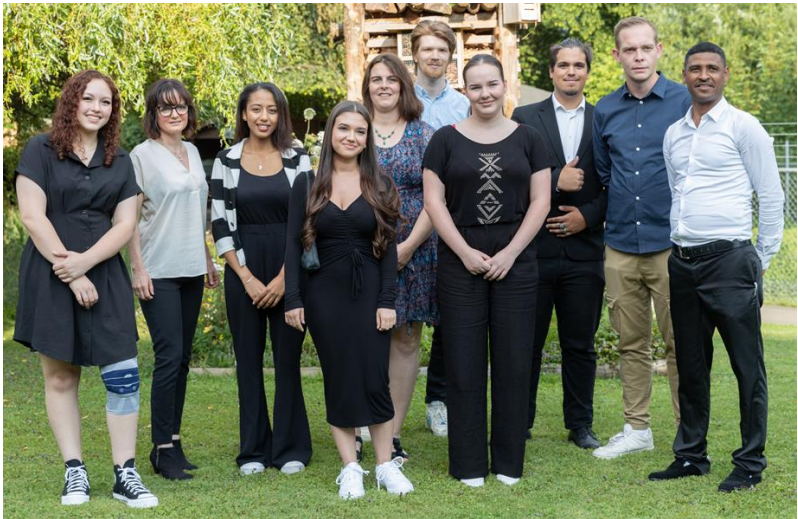
Unsere Sunneziel-Absolventinnen und Absolventen 2023